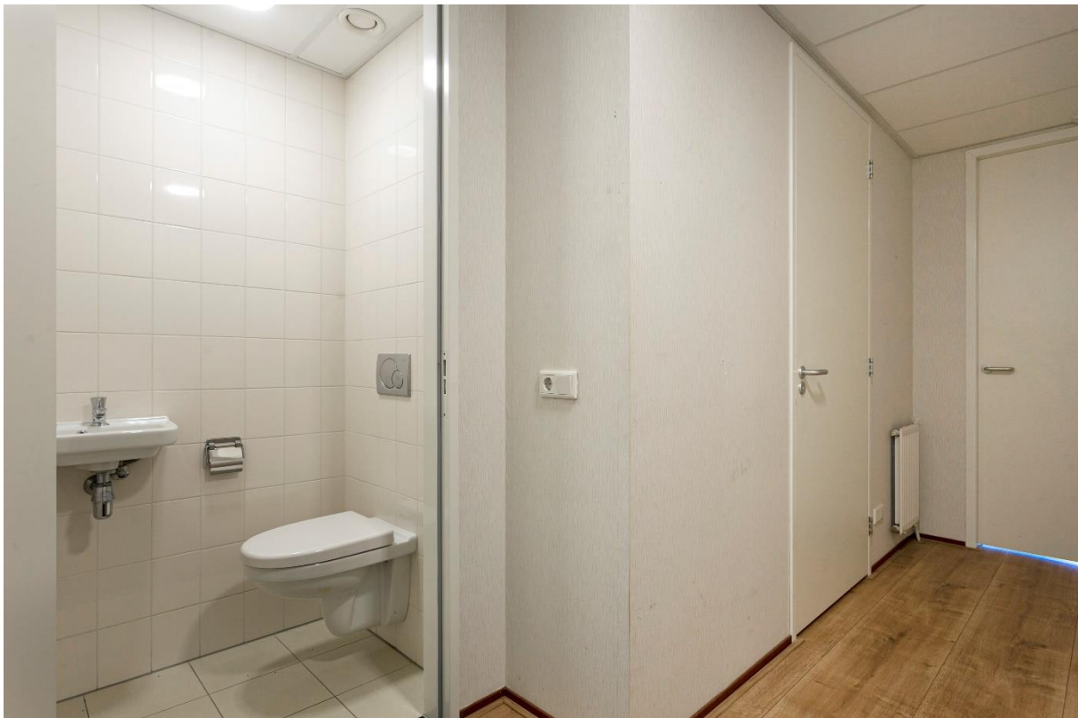
Separaat toilet in hal